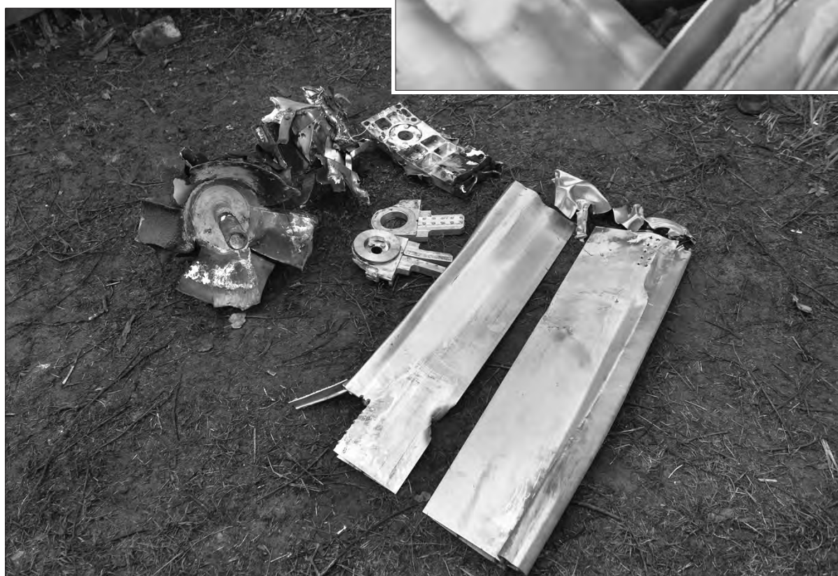
Залишки російської бомби-ракети.